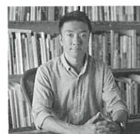
石川直樹 | 写真家

1977年東京生まれ。東京芸術大学大学院美術研究科博士後期課程修了。人類学、民俗学などの領域に関心を持ち、辺境から都市まであらゆる場所を旅しながら、作品を発表し続けている。『NEW DIMENSION』(赤々舎)、『POLAR』(リトルモア)により、日本写真協会新人賞、講談社出版文化賞。『CORONA』(青土社)により土門拳賞を受賞。著書に、開高健ノンフィクション賞を受賞した『最後の冒険家』(集英社)ほか多数。